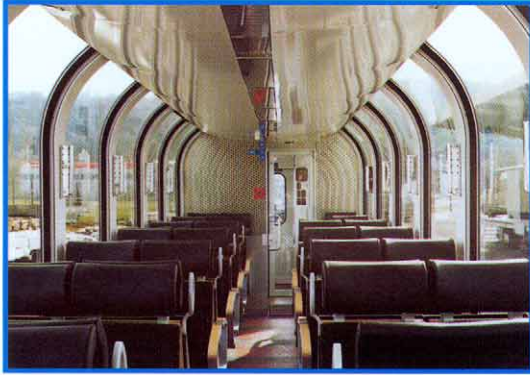
Innenraumgestaltung im Wagen B